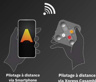
Pilotage à distance via Smartphone